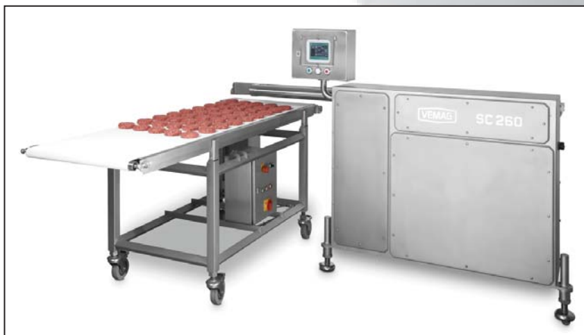
ФЕМАГ шаттл-конвейер 260

Выберите шаттл-конвейер 260 фирмы ФЕМАГ и извлеките выгоду от исключительно точного позиционирования и высочайшей производительности по перекладке продукта.